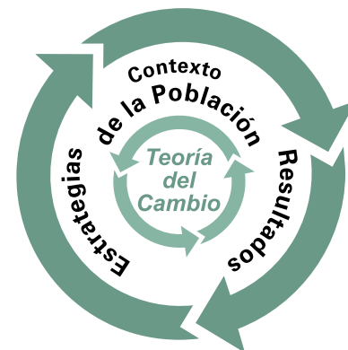
Figura 1: Teoría del Cambio Componente 2

Entender y expresar las relaciones entre los tres elementos centrales